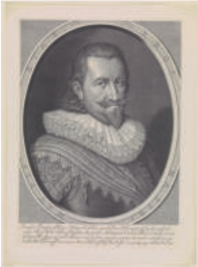
König Christian IV. von Dänemark und Norwegen, 1629