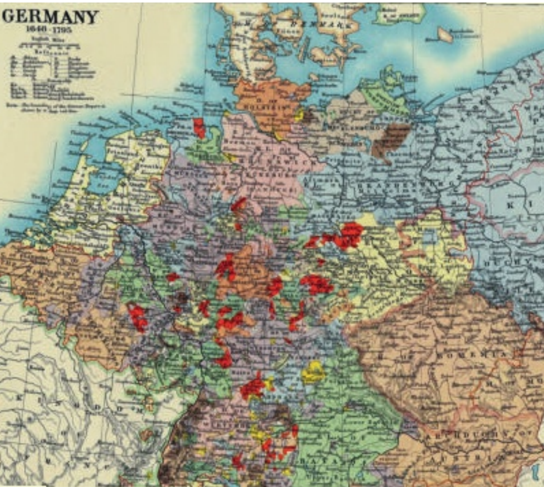
Die Söldner legten bis 1634 insgesamt ca. 8000 km zu Fuß zurück. Offiziere hatten Pferde.

Auseinandersetzungen wandten sie diese Erkenntnisse aufs allerbeste an und machten damit ihrem soldatischen Ruf alle Ehre – doch vergebens: Der sogenannte Dänisch-Niedersächsische Krieg und damit ihr Einsatz geriet zum Debakel.