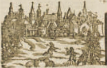
Gezeichnet im Jahr 1672. von M. J. J. J.

welche am 27. Tag Martij dieses 1672. Jahres/ von der Königl. Majest. allerschweren und allerschwersten handt angegriffen und erobert worden: so von beschriben bey der Stadt Verlegung und sonst beschriben wirdt durch verlegungen.