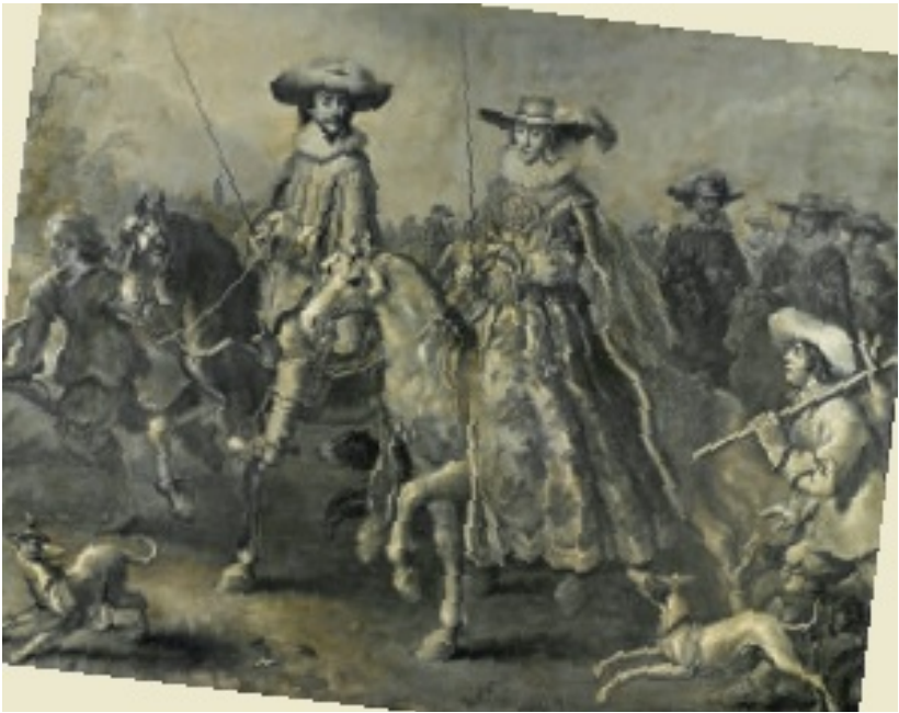
Adriaen Pietersz van de Venne: Kurfürst Friedrich V. von der Pfalz (1596–1632), König von Böhmen, und seine Frau Elizabeth Stuart (1596–1662), Rijksmuseum Amsterdam

Innenpolitisch rieb sich Jakob am Parlament, das den absolutistischen Anwendungen des Königs Riegel um Riegel entgegensetzte, und seine Regierungsanfänge waren noch von konfessionellem Streit geprägt. 1605 war der protestantische König knapp der „Schießpulverschwörung“ entgangen: Radikale Katholiken um Guy Fawkes – bösen Bemerkungen nach der einzige Mann, der jemals das Parlament mit ehrlichen Absichten betreten hätte – hatten versucht, ihn anlässlich der Parlamentseröffnung samt Familie, Regierung und Parlamentariern in die Luft zu jagen. König Jakob hegte Katholiken gegenüber deswegen jedoch keinen besonderen Groll – so lange sie die Füße stillhielten.