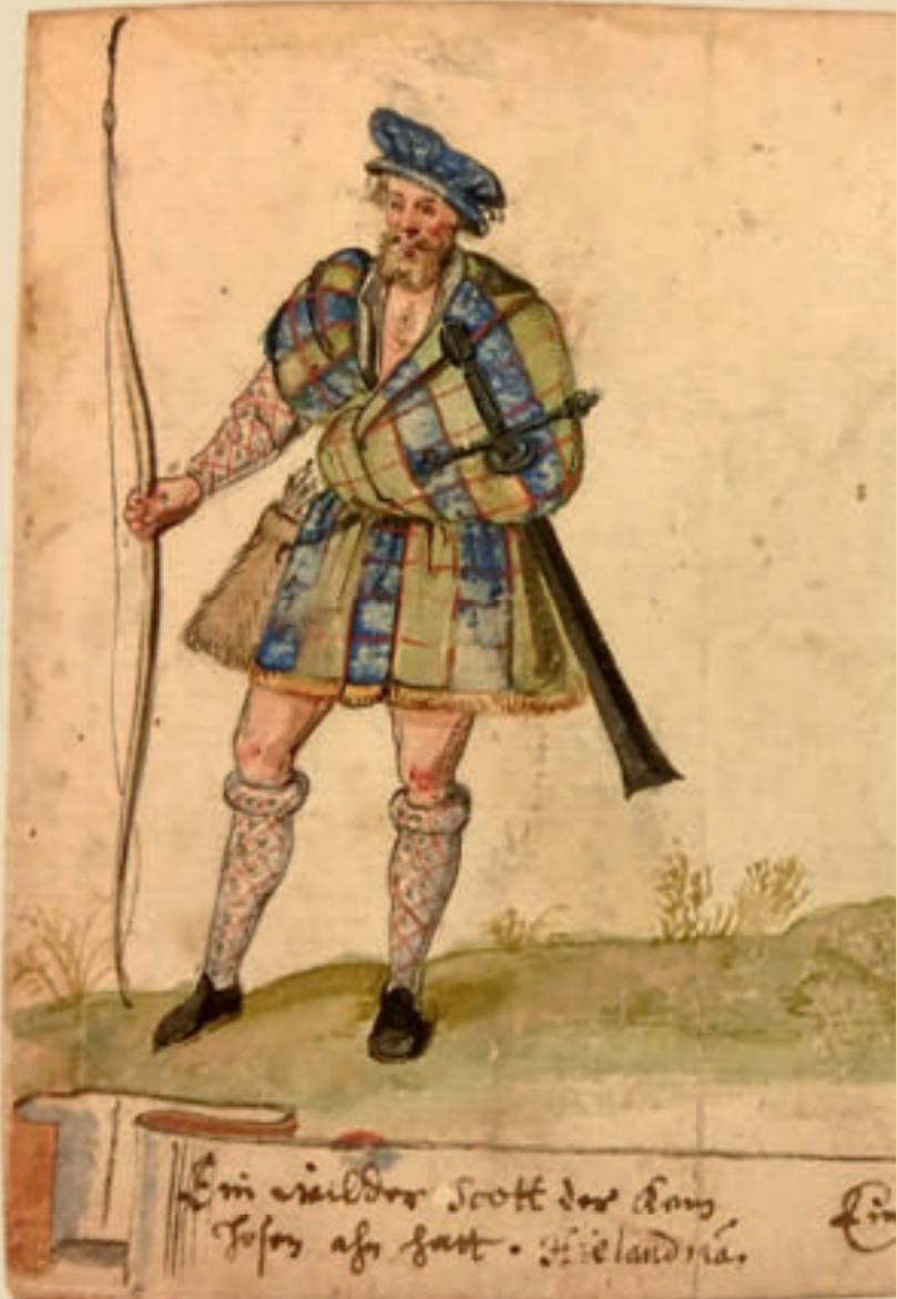
„Ein wilder Scott der kein Hosen ahn hatt. Hielandria“. Zeichnung von Hieronymus Tielsch, um 1603, The Huntington Library, San Marino CA.