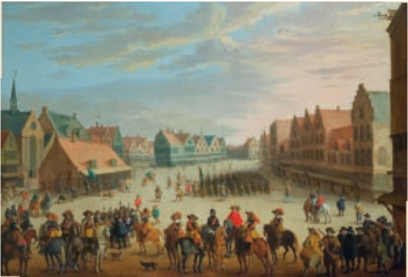
Joost Cornelisz Droochsloot: Prinz Moritz von Oranien verabschiedet die schottischen Söldner in Utrecht 1618.

Die Männer erhielten mit ihrer Unterschrift Geld im Gegenwert einer Kuh, ihr Jahreseinkommen, wäre es denn bezahlt worden, entsprach beim einfachen Infanteristen dem eines Händlers, beim Offizier dem eines Handwerksmeisters. Mackay füllte die fehlenden Ränge durch die Zwangsverpflichtung von herrenlos aufgegriffenen Highlandern und durfte auch die in Edinburgh eingekerkerten MacGregors für seine Zwecke befreien lassen, wenn diese sich verpflichteten, nach dem Krieg nicht mehr nach Schottland zurückzukehren. Am 6. Oktober 1626 legten die ersten 3000 Mann auf einem halben Dutzend Schiffen von Cromarty ab, begleitet von einigen Kriegsschiffen des holländischen Verbündeten zu ihrer Absicherung. Der erkrankte Mackay war nicht an Bord; ohnehin war seine Anwesenheit in Schottland zur Aushebung weiterer Truppen weit wichtiger.