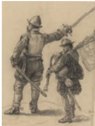
Illustration, 19. Jh.