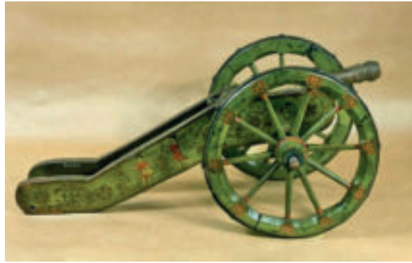
Kanone der Infanterieeinheiten

Besonders begeistert war man über die Schweden nicht, zumal ihr König die protestantischen Landesfürsten bald verstehen ließ, dass sie Vasallen seiner Krone würden, und die Erfolge seiner Invasion sich nicht einstellten, obwohl Gustav Adolf die modernste Armee der Welt unterhielt. Der „Löwe von Mitternacht“, wie man das nordische Raubtier bald nennen würde, hatte nicht nur eingehend die Oranische Heeresreform studiert und umgesetzt, sondern auch seine fähigsten Männer gleich direkt zu Moritz von Nassau geschickt, um sie so gut wie möglich ausbilden zu lassen. Zu dieser gezielten Förderung eigener Talente kam noch das persönliche Genie wie das des schwedischen Artilleriechefs Lennart Torstensson hinzu, der statt der üblichen Zwölfpfünder kleinere, leicht manövrierbare Kanonen gießen ließ und jedes Infanterieregiment mit vier Dreipfündern ausstattete, die jeweils vier Schüsse in der Minute abgeben konnten.