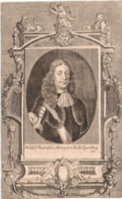
Rudolf Maximilian von Sachsen-Lauenburg