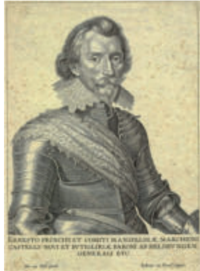
Ernst von Mansfeld, um 1630

Vom König sowie dem Kronrat (Privy Council) ermächtigt, führte Sir Donald Mackay mit Hilfe befreundeter Clan-Leader zwei Musterungen für insgesamt 5000 Männer durch. Diese zwei Truppenaushebungen waren die ersten von insgesamt 27, die bis 1634 stattfinden und insgesamt 38 500 Schotten betreffen sollten, d. h. fünf Prozent der männlichen Bevölkerung. Dabei waren stets nur Infanterieeinheiten vorgesehen, da der Export von Pferden in Krisenzeiten im Königreich untersagt war – und wann steckte es nicht in der Krise?