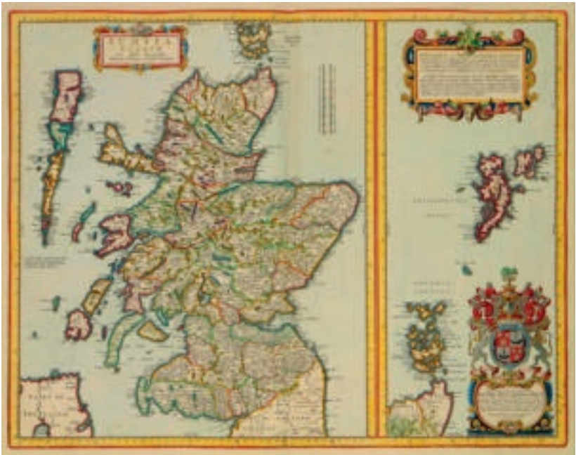
Scotia Regnum cum insulis adjacentibus, 1654, Kupferstich von Joan Blaeu nach Robert Gordon of Straloch, Koninklijke Bibliotheek, Den Haag