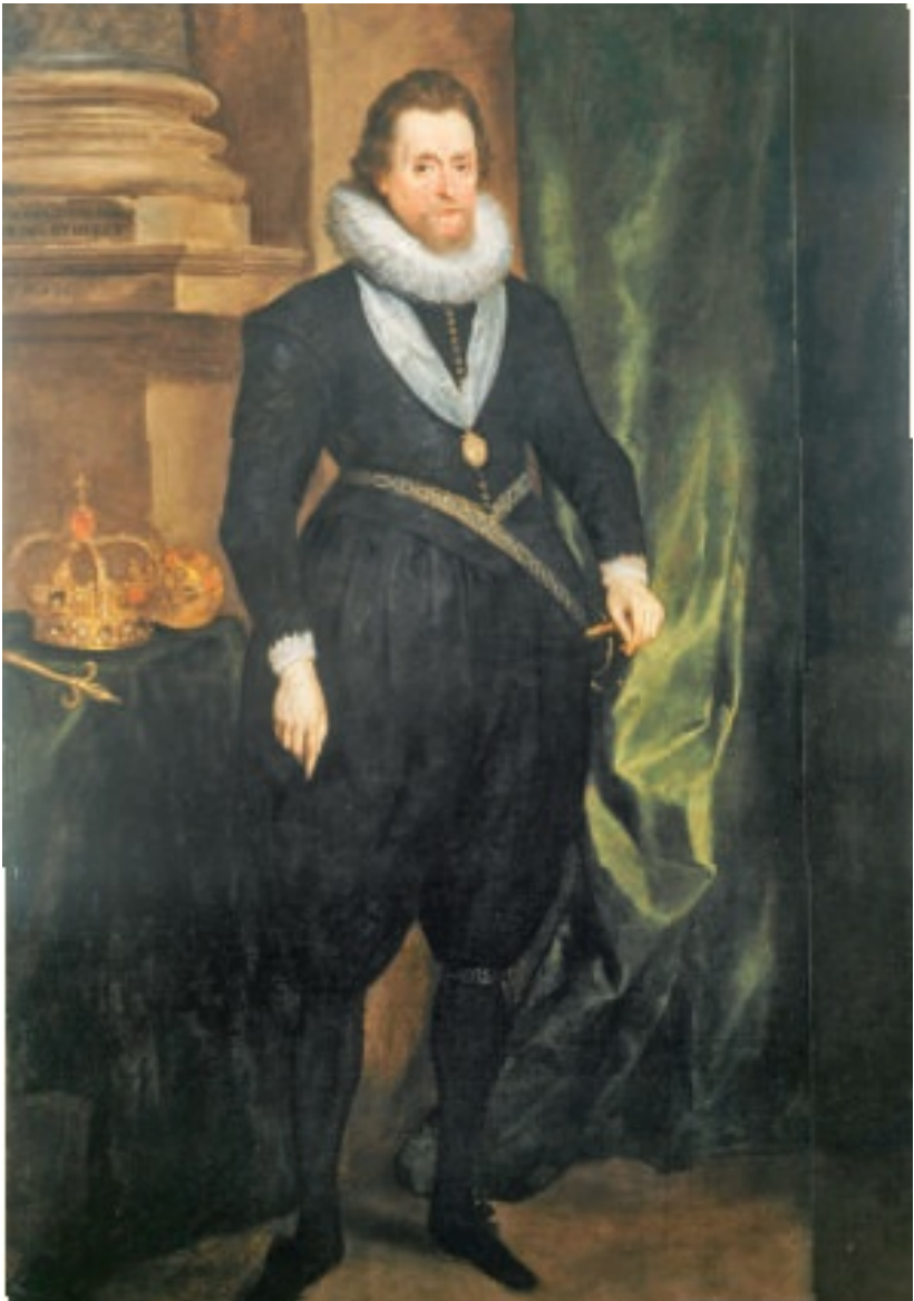
Antonius van Dyck: König Jakob I. (1566–1625), posthum, um 1632, Royal Collection, Windsor Castle