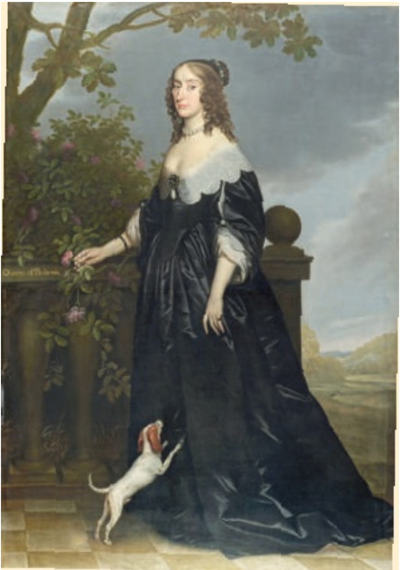
Gerrit van Honthorst: Elizabeth Stuart, Königin von Böhmen, 1642, National Gallery, London