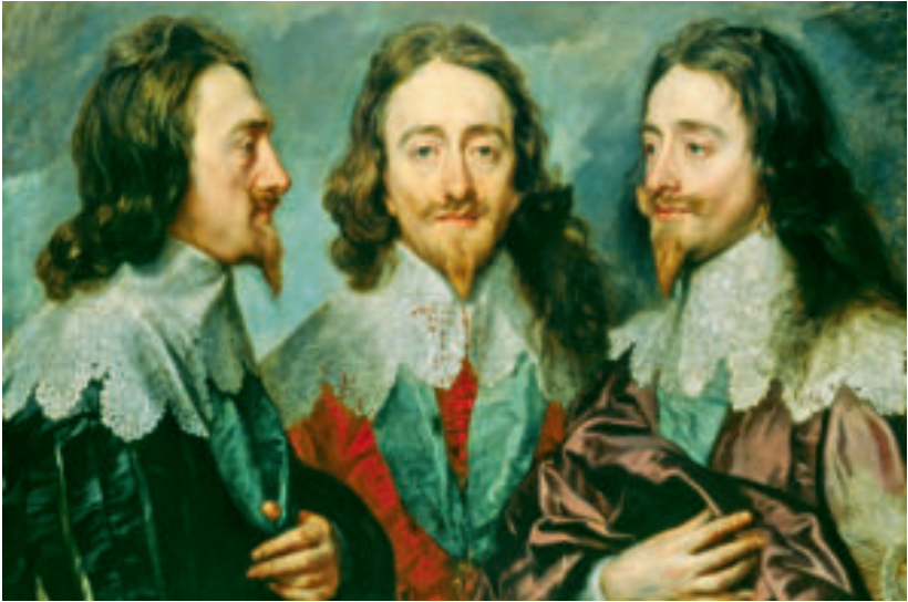
Anthony van Dyck: Karl I., 1636, Royal Collection, Windsor Castle. Ironisch an diesem Tripleporträt ist, dass der König am Ende gar keinen Kopf mehr hatte. Er wurde 1649 geköpft.