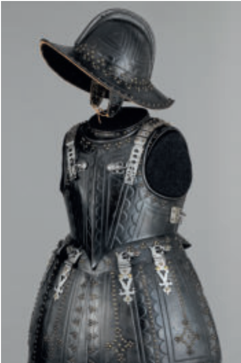
Pikenierharnisch, um 1625

Die Schotten lernten in der dem Winter geschuldeten, mehrmonatigen Kampfpause, die komplexen Piken-Befehle umzusetzen und sich dabei wie ein Igel im Feld zu bewegen sowie eine Muskete zweimal in fünf Minuten abzufeuern. Bei den im Frühjahr 1627 wiedereinsetzenden kriegerischen