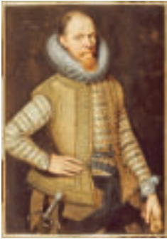
Moritz von Nassau, Prinz von Oranien und Statthalter der Nieder- lande, 1608