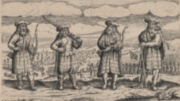
Es ist ein Ständer dinsteliger Dack, welcher sich mit geringer Zeit hat ein Vieh bracht so Essen zu Warten. Was auch die Natur erfordert können sie der Tages Über die 20 Tagelinge mit wenigem laugen, haben vielen Aufschaden ihre Dingen mit Fischen und Lamm Milch.

In solchen Habt Gehen die 800 In Stattin angekommen Irriändler oder Irren.