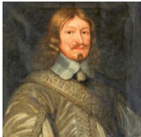
Lennart Torstensson, um 1700