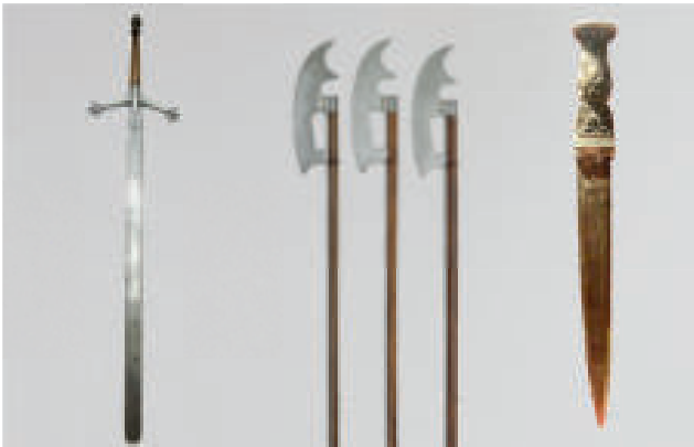
Schottischer Claymore, um 1625