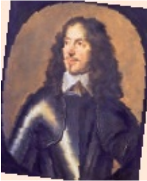
William Craven, um 1640