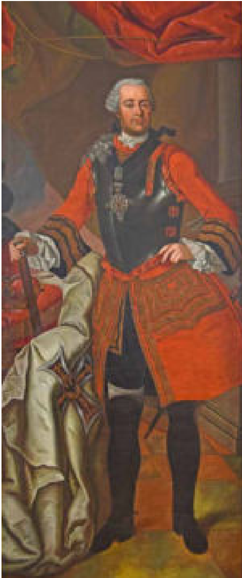
Hoch- und Deutschmeister Karl Alexander Herzog von Lothringen und Bar (1761–1801). Pädagogische Stiftung Cassianeum.