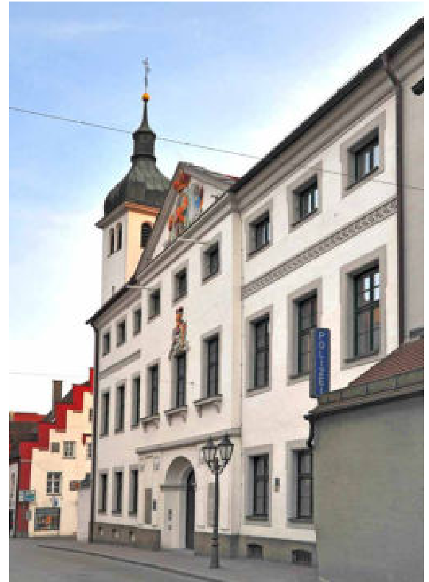
Deutschordenshaus an der Kapellstraße, Donauwörth.

Zelzer – Maria Zelzer: Geschichte der Stadt Donauwörth Bd. 1, Donauwörth 1979