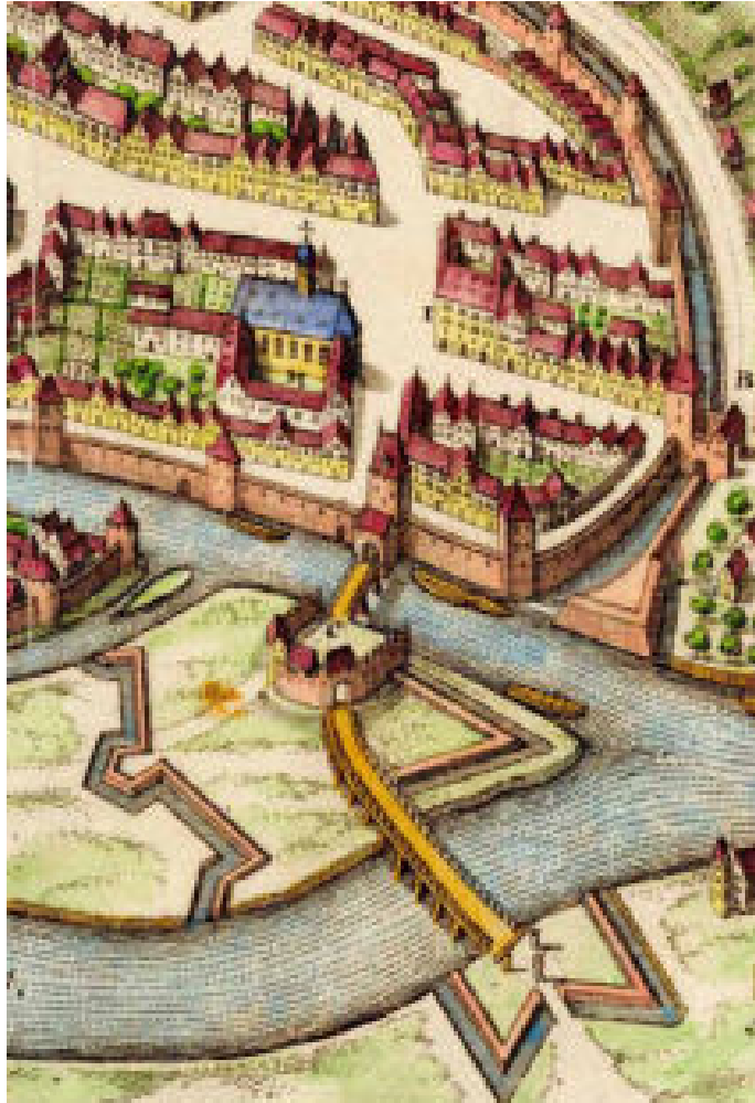
Die Deutschordenskommande auf einem altkolorierten Kupferstich von Matthäus Merian, 1644 (Ausschnitt).

Adelsgeschlecht Waldecker von „Kempt“ nannte sich nach Kaimt, einem Stadtteil von Zell an der Mosel, und ist erloschen. 7 Das Dorf Seckendorf bei Cadolzburg im Landkreis ist zwar der Ursprungsort der gleichnamigen Grafen und Freiherren, die aber heute noch blühen und sich Seckendorff schreiben.