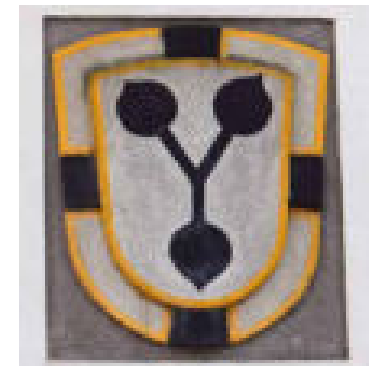
Eichgasse, ehem. Spital. Erneueres Wappen des Landkomturs Johann Konrad Schutzbar gen. Milchling.