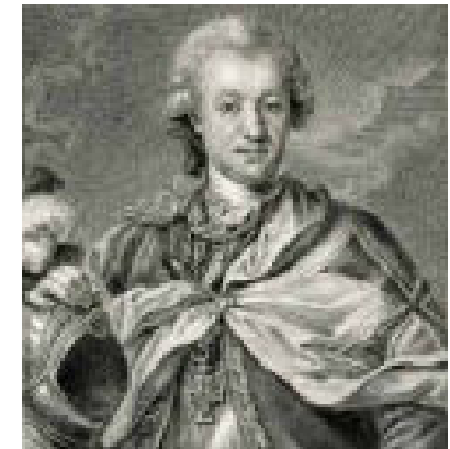
Wappen und Portrait des Landkomturs der Ballei Franken (1765–1787) Franz Sigismund Freiherrn von Lehrbach.