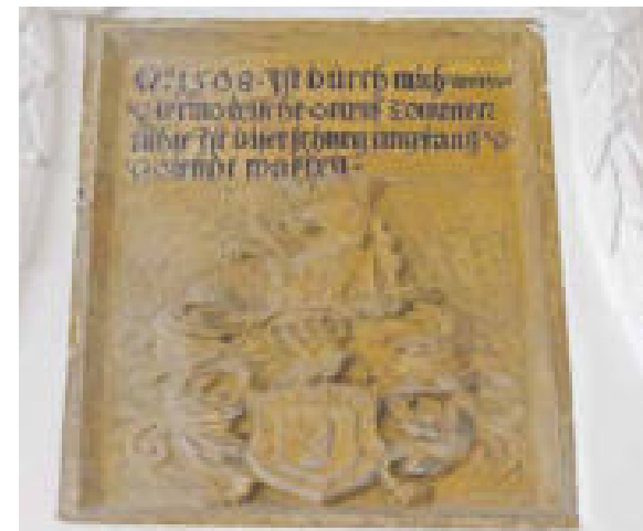
Wappenstein des Komturs Melchior von Thermo im Deutschordenshaus.

Adelsgeschlecht der Niederlausitz – Kneschke Bd. 9, S. 184 1553 Investitur – Seiler S. 527 1554 Baumeister Mergentheim – Borchardt S. 880 1554 Verwalter Virnsberg und Rothenburg – Borchardt S. 880 1554–1559 Hauskomtur Rothenburg – Borchardt S. 764 1556 Verwalter Virnsberg – Borchardt S. 523 1559 Komtur Virnsberg – Borchardt S. 33 1559–1561 Hauskomtur Nürnberg – Seiler S. 527; StA N, Ritterorden U 3257